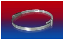
CLAMP 210 BRIDGE CLAMP